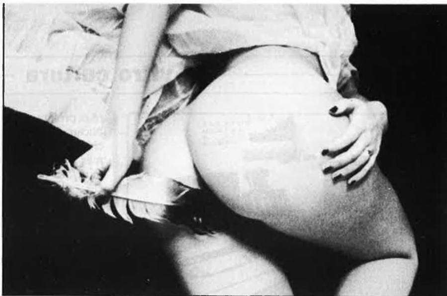
La competència editorial farà esmolar la ploma als escriptors eròtics.

«La Piga» serà a les llibreries d'aquí a pocs dies i tenen previst fer la presentació en societat el dia 12 d'abril. Els dos primers títols seran un original català d'un escriptor conegut que firma amb el pseudònim Clar de lluna i que es titula Moltatela , i el Kamasutra , en versió d'Àlvar Valls.