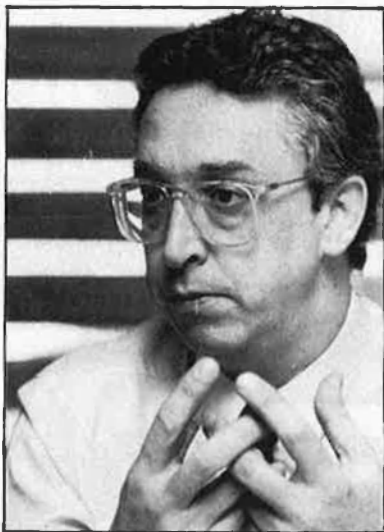
«El benefici que Barcelona traurà de les Olimpíades serà social».

riem? No hi ha socis per repartir interessos, ni ho podem tornar a les institucions perquè no són accionistes del projecte. Jo crec que el benefici que obtindrà Barcelona serà un benefici social: Barcelona guanyarà uns cinturons, la modernització del Metro, i la recuperació de la franja costanera, a més de la promoció de l'imatge exterior i del turisme. A part d'aquests beneficis socials tangibles, la cultura ca-