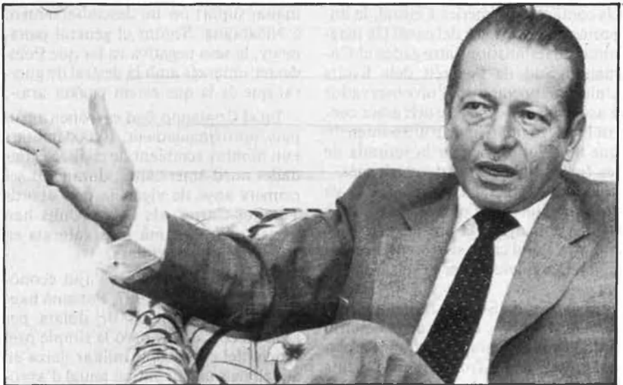
Delvalle: la situació se li girà d'esquena.

Però, pocs mesos més tard, el Senat colombià va rebutjar el tractat, la qual cosa va exacerbar els ànims de la burgesia panamenya. El govern nord-ame-