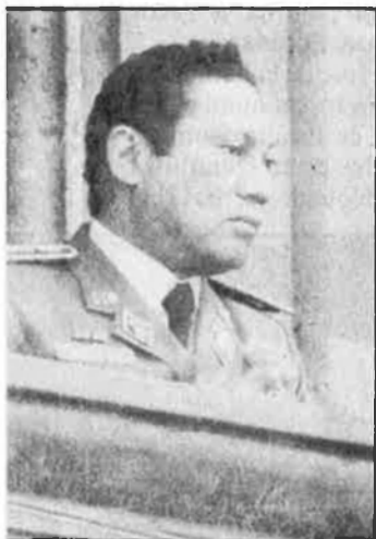
El General Manuel Antonio Noriega.

Manuel Solís Palma, com a nou ministre encarregat de la presidència.