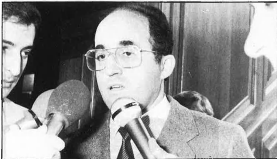
Hipólito Gómez de las Rocas, d'Astúries a amo del PAR.

ritorials que sota l'adscripció al regionalisme han obtingut percentatges significatius de vots i representació sempre o quasi sempre a compte de l'electorat i representació de la dreta conservadora, tot presentant-se en solitari i en competència amb aquesta, encara que anteriorment alguns hagueren figurat coaligats amb AP al si de la CP. Els casos d'EU (Extremadura), les diferents formacions illenques (a Canàries), el PRC (Cantàbria), el PRP (La Rioja), la UPN (Navarra), el PAR