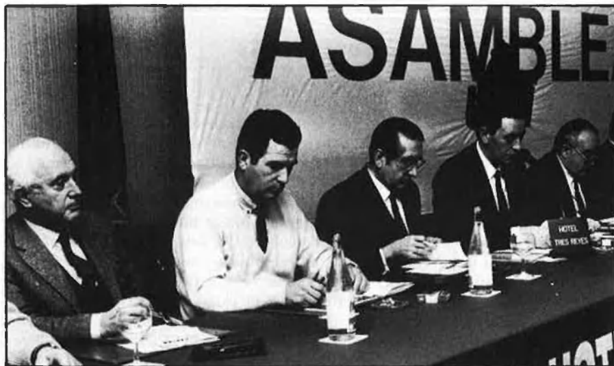
Unión del Pueblo Navarro, un bastió contra l'annexionisme basc.

Els 212 regidors, 10 alcaldes, 3 diputats provincials a València i 6 parlamentaris a les Corts del país, no són tant resultat d'una evolució política, sinó del transfuguisme que ha degotat la irreversible agonia valenciana d'AP. Tan sols a les comarques meridionals ja són tres els ex-presidents provincials d'AP que avui cotitzen a UV. Una nodrida representació institucional d'an-