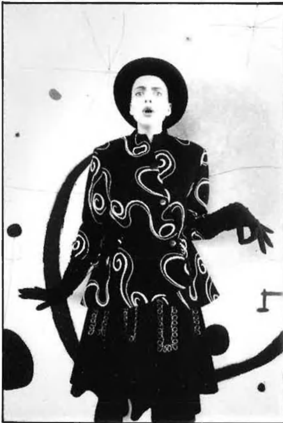
Dalt, model de Roser Marcó. A la dreta, model de Vicente Mateu.

grans volums, combinats cenyidíssims al cos, grans abrics i pantalons. Per a la nit, drapejats i transparències. Llástima que aquestes transparències no foren llúides correctament per les models, que es mostraren molt puritanes a l'hora d'ensenyar els pits.