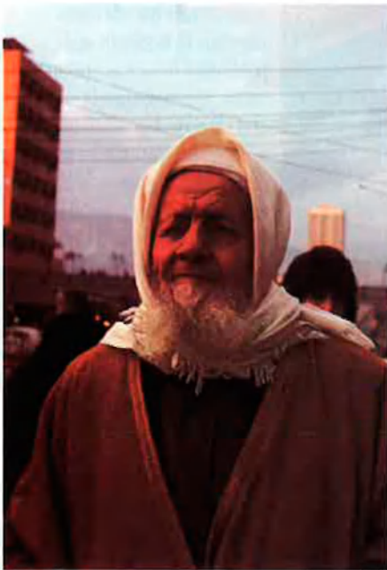
La gent del carrer no parla de política nacional.

número u és el jueu. D'altra banda, tot està bé, parlar de sobres és buscar-se conflictes. No importa on ni amb qui es parle, qualsevol pot ser un muhabar (agent secret) i qualsevol comentari en contra del règim pot dur el ciutadà, i també l'estranger, a la presó. Els muhabarats, que en principi tenien la funció de detectar els terroristes israelians, desenvolupen també la de controlar, a nivell de carrer, els presumptes enemics del règim. Però a Síria hi ha pocs enemics del règim, si més no