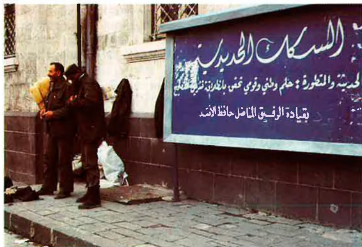
«Ací, la dona no pot dir res, sempre té un home darrere que vol protegir el seu honor».