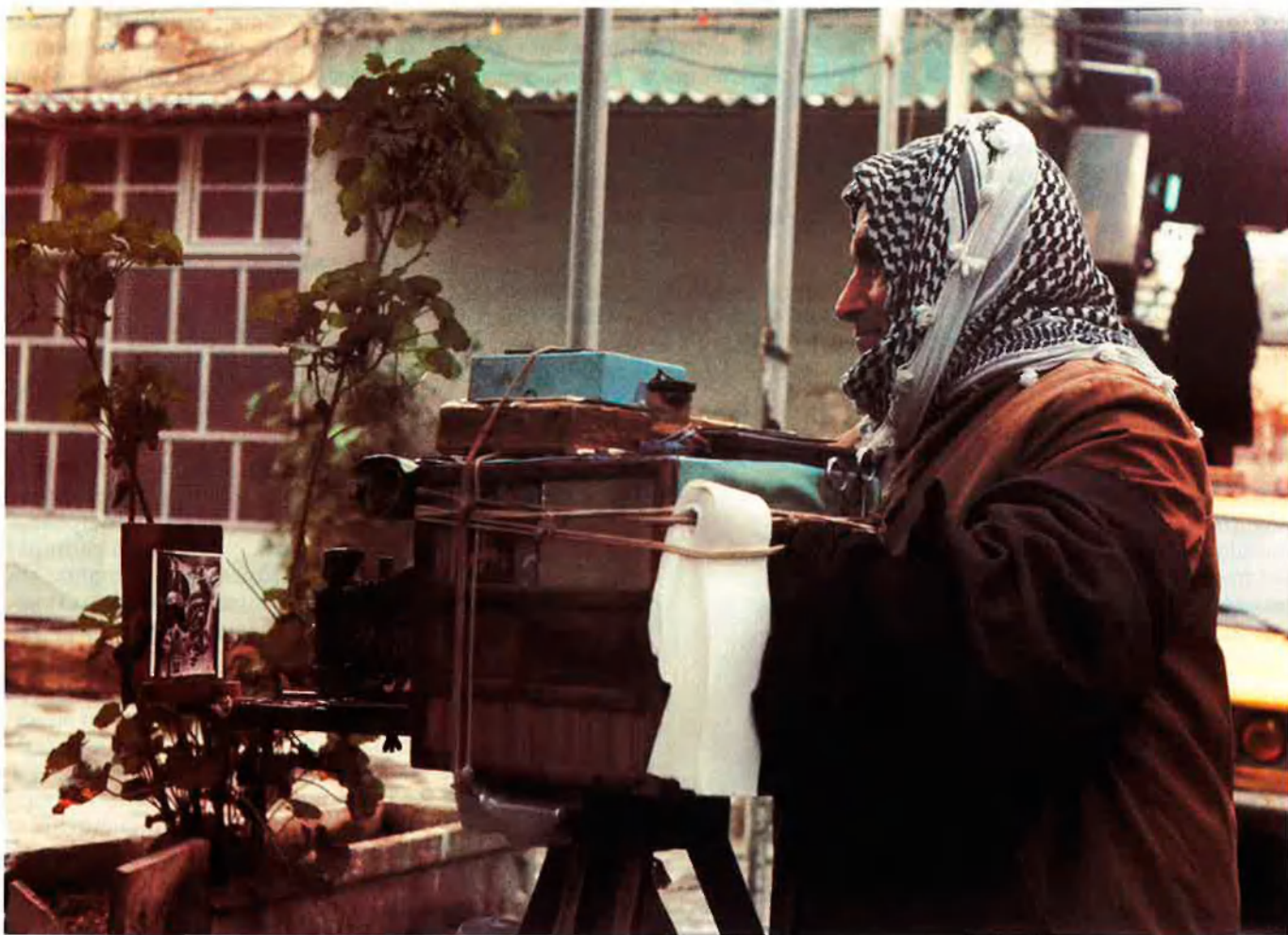
Els siris, davant el turista, presumeixen de viure bé, amb seguretat, en una societat on no hi ha problemes.

al carrer. És més, els siris presumeixen davant del turista de viure bé, amb seguretat, dins d'una societat on no hi ha problemes si un no se'ls busca.