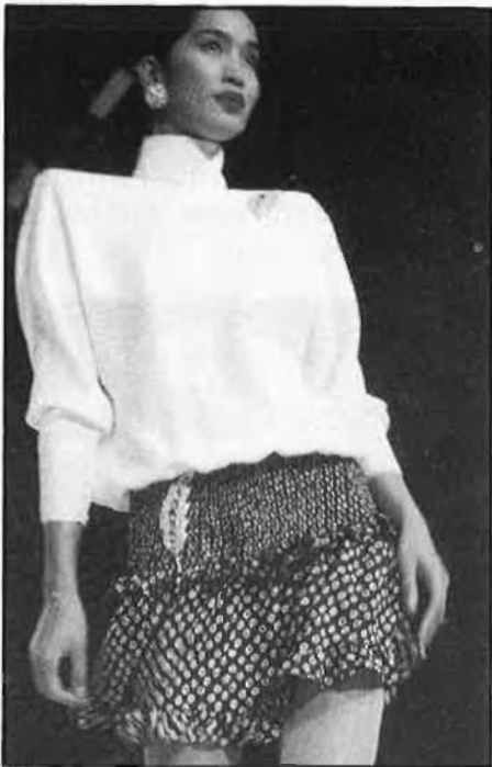
Model de Valentino.

Avui dia, però, molt poca gent recorda que el venerat i llorejat Armani —premi Balenciaga 1987, premi Neiman Marcus, quatre voltes guanyador del guardó Cutty Sark al millor creador internacional de moda d'home, millor modista internacional durant 1983 segons el Consell Internacional de la Moda Nord-americana, Gran Oficial de l'Orde del Mèrit de la República Italiana...— organitzà la seua primera desfilada als salons del bell restaurant milanès Carminatti amb una petita concurrència composta sobretot per periodistes estrangers i ignorat per la premsa del seu propi país. □