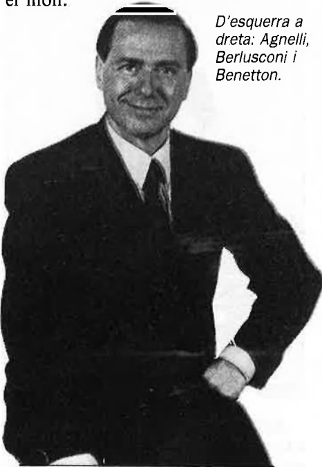
D'esquerra a dreta: Agnelli, Berlusconi i Benetton.

Aquesta empresa va ser fundada a començaments de segle per l'avi i s'ha mantingut sempre sota el control de la família. Tot i això, Giovanni Agnelli, que porta camí de complir setanta anys, no ha estat sinó molt tardanament al peu del canó de la indústria. Dels vint-i-cinc anys d'edat fins als quaranta-cinc, Agnelli es va dedicar a viatjar i compartir experiències amb els grans de la política i els diners de tot el món.