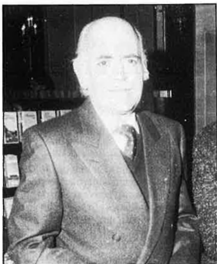
Lasso de la Vega.

una sèrie d'actuacions pels Països Catalans.