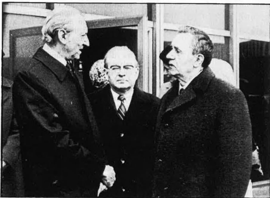
Waldheim, rebut per Gromyko: eren altres temps.

Waldheim, impertèrrit, tot i emprar un llenguatge més aviat lacònic, es mostra bastant clar sobre els seus projectes de futur: «La meua dimissió per pressions, sepultaria tots els principis democràtics». Declaració que acaba traient de polleguera a Vranitzky i amenaça de ser ell qui dimiteixi: «El cas Waldheim ocupa un 60 per cent del temps del meu càrrec tant a dins com a fora del país i començo a preguntar-me si m'hauria de buscar una altra feina».