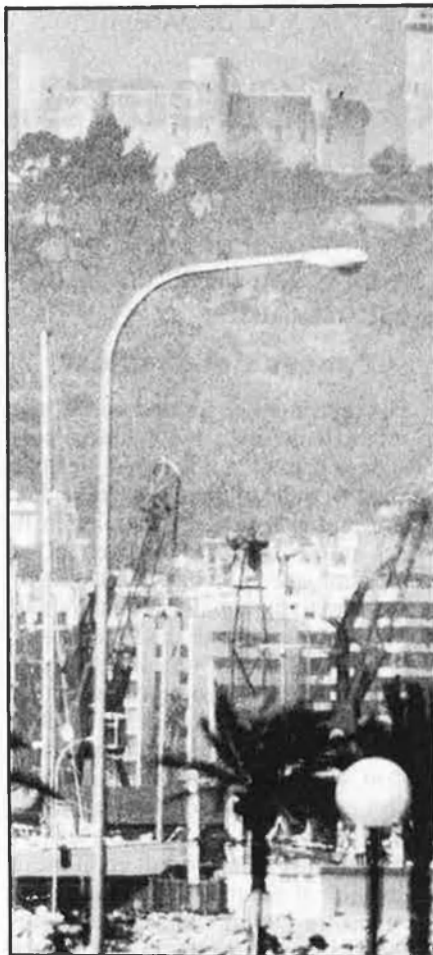
Balears: problemes econòmics rellevants però solubles.

cupar no són les dimensions del dèficit, sinó el fort ritme del seu creixement en termes reals. El problema rau no tant en el fet de tenir un dèficit comercial elevat, com en el fet de tenir un dèficit que creix a un ritme desbocat. Diem desbocat perquè és molt gran i perquè és creixent. És molt gran perquè és de l'ordre del 9 per cent anual acumulatiu i és creixent, com posa en relleu la progressiva inclinació de la corba més alta del gràfic adjunt.