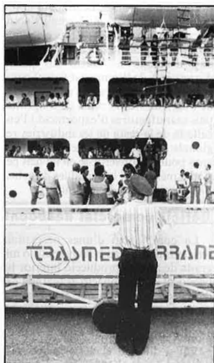
Turisme: un exemple d'especialització sectorial.

El desajust s'ha produït en la mesura en què el sistema productiu balear s'ha mostrat, amb reiteració i amb obstinació, incapaç d'adaptar els volums de la seva producció de béns als ritmes de creixement de la demanda. En els anys de referència, mentre la deman-