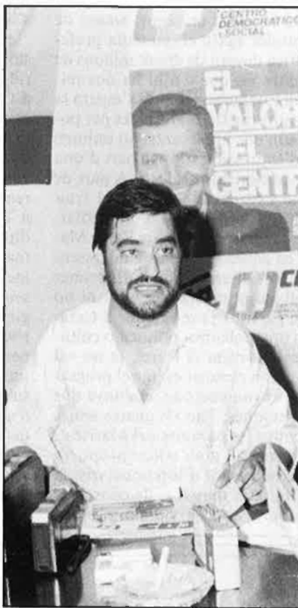
«No m'intimida el terme Països Catalans».

No comprenen que el més important no és el passat sinó fer el futur, aquesta por fa que ho deixen en segon ordre quan altres persones pensem que és una de les qüestions més importants que cal no callar i per això ens pronunciem en el tema de la llengua, que és un tema de futur. Això produeix que, dins d'un mateix partit, segons l'àmbit on es produeixen les declaracions, apareguen