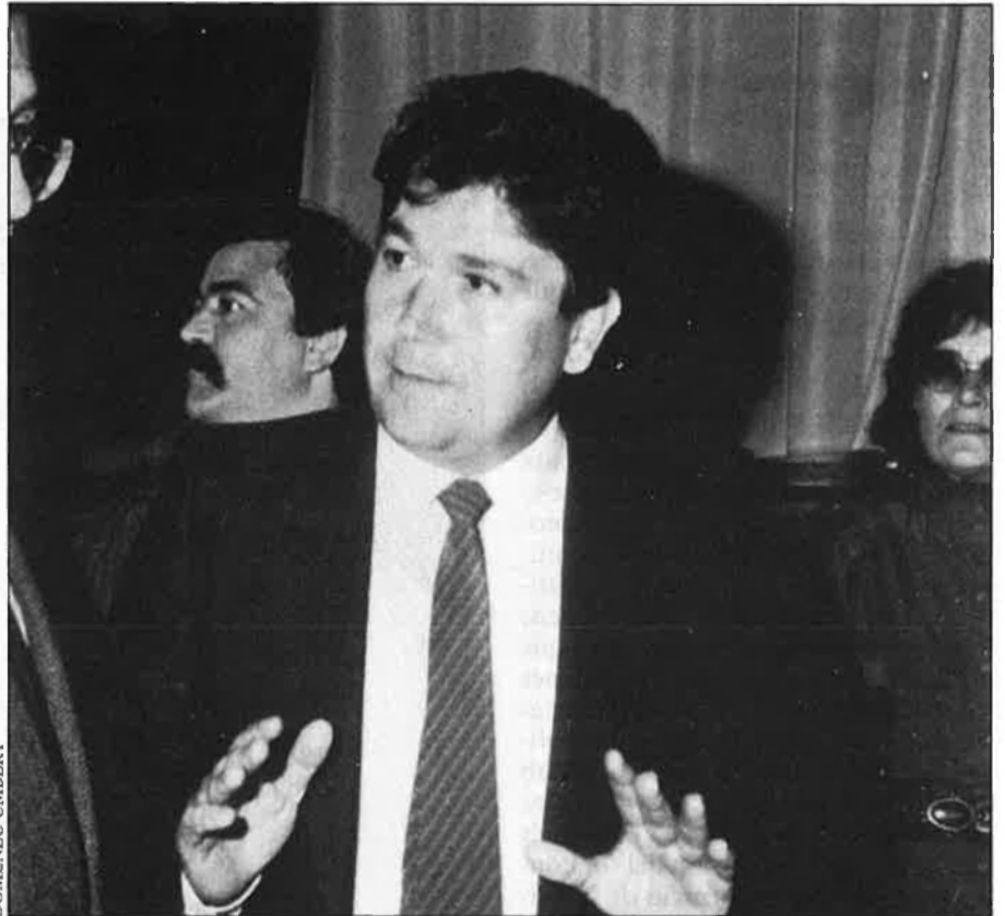
Garcia Prieto no volia saber-se'n res, d'Obregón i el seu partit.