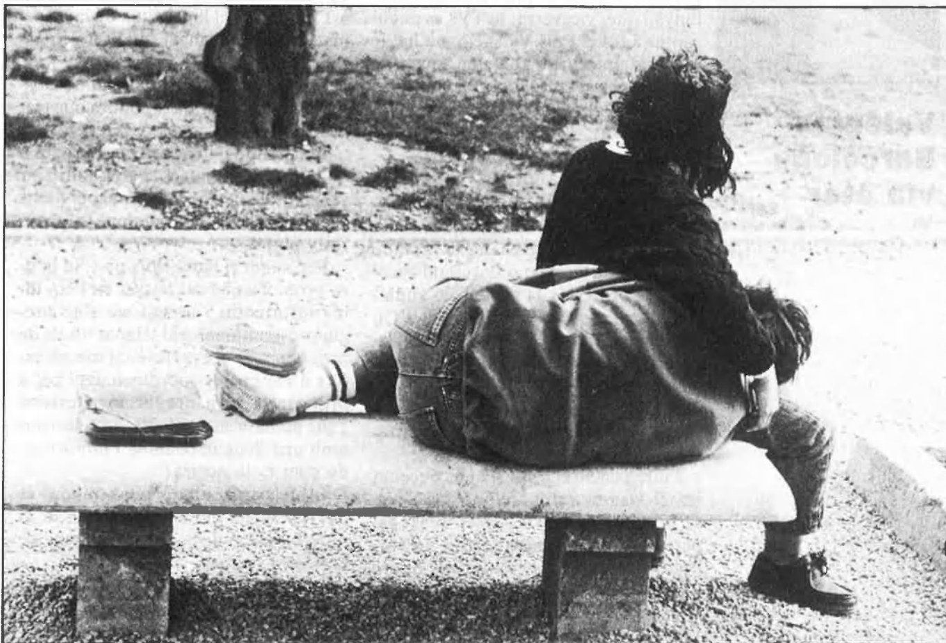
Les actituds socials dels estudiants han canviat molt poc en els últims anys.

L'estudi realitzat per Xambó abraça un total de 900 enquestes realitzades a joves estudiants de Formació Professional i BUP. Crida l'atenció, en primer lloc, comprovar com les actituds socials dels estudiants han canviat