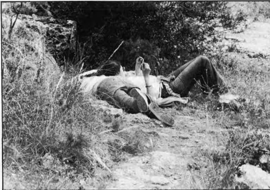
Segons els terapeutes, la incomunicació és un factor important de la insatisfacció sexual.

cent dels que confessaven haver tingut aquesta experiència declaraven sentir-se angoixats davant la possibilitat que es poguera produir un embaràs, fet que, sens dubte, demostra el sentiment de por i culpabilitat que experimenten els joves en les seues relacions sexuals.