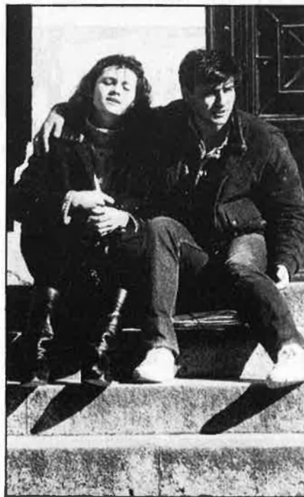
Sovint no se sap ni on anar a cercar informació.