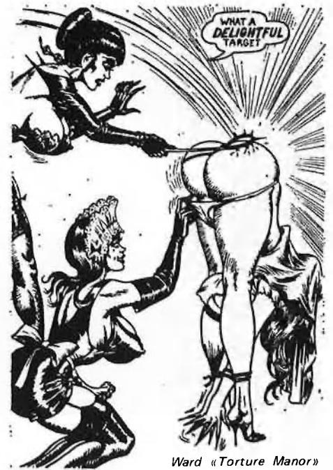
Ward «Torture Manor»

A Barcelona, sense anar més lluny, és possible concertar cites amb amants del sado sense pagar ni un duro. De la mateixa manera que hi ha bars, agèn-