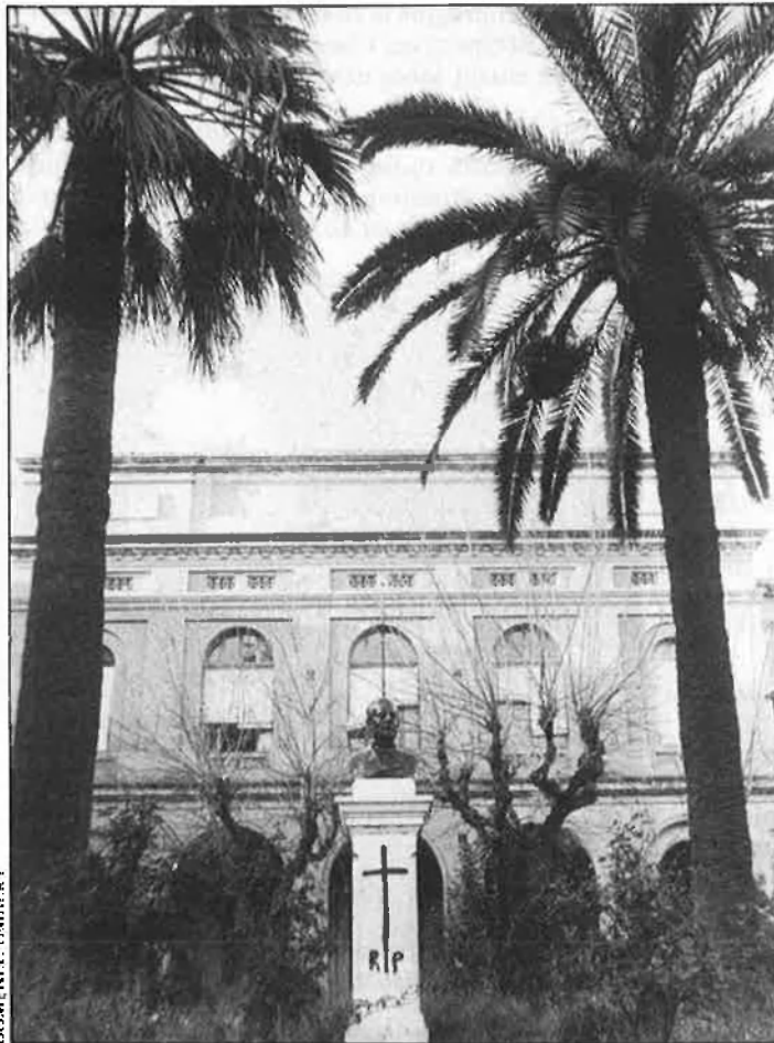
Hospital de la Santa Creu.

seguet de denúncies contra els directors de la Santa Creu, la Diputació i, fins i tot, el mateix batlle de Barcelona, Pasqual Maragall, acusats de «coaccionar i drogar els malalts per vèncer la seva resistència». Un dels exemples pràctics que donen per demostrar aquestes afirmacions és el d'un pacient que suposadament va ser introduït en un vehicle assegurant-li que el portaven a la universitat, un dels seus somnis.