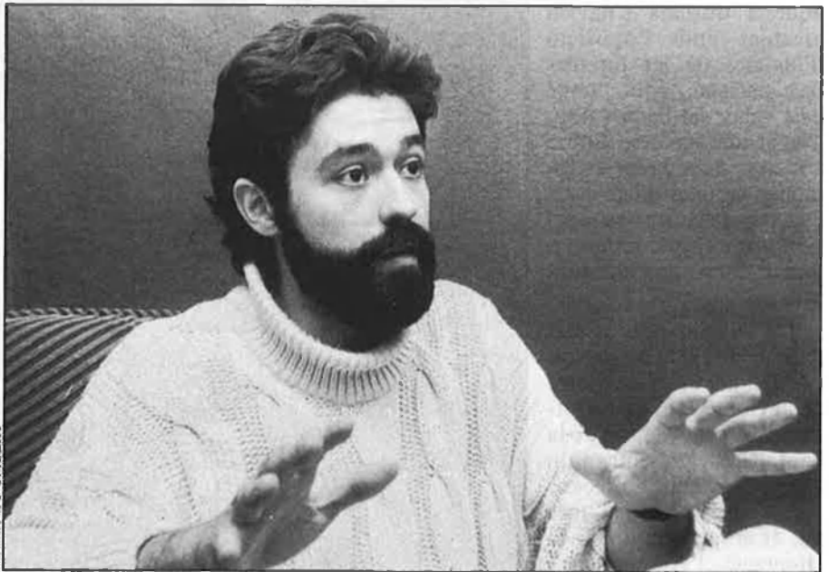
«El problema no és Mariscal sinó el COOB».

—El fet que hàgiu organitzat unes jornades àrabs, o que ara feu accions en suport de Palestina, que entre d'altres consideracions us ha fet merèixer