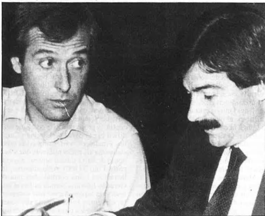
Curriel i Iglesias deixen pas als homes del sud.

Mentre en el plenari, catalans, madrilenys i una part dels andalusos aboaven obertament i decididament l'ascens de Julio Anguita, aquest, sotmès a fortíssimes pressions per totes bandes, tingué una reacció irada i repetí en termes tallants —«és irrevocable»— la seva decisió de no ocupar la secretaria general. Llavors, el desconcert esdevingué pànic i a partir d'aquell moment el XII Congrés es bolcà perquè Anguita es desdigués de les seves promeses. Estava clar que no hi havia ningú més per assumir la direcció del partit. Tant i tant se li va insistir, que a última hora de la tarda de dissabte el dirigent andalús havia donat diverses mostres