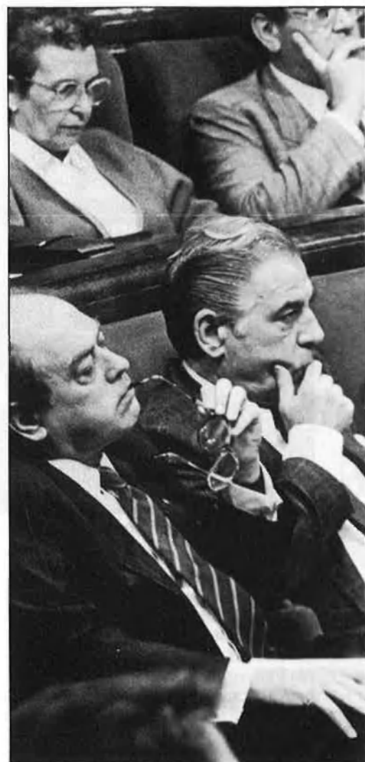
El president Pujol esgota la legislatura i obre la pausa actual.

En l'expectativa de les eleccions autonòmiques es produí el triomf, al-