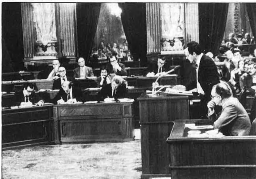
Parlament balear: massa temes encara pendents.