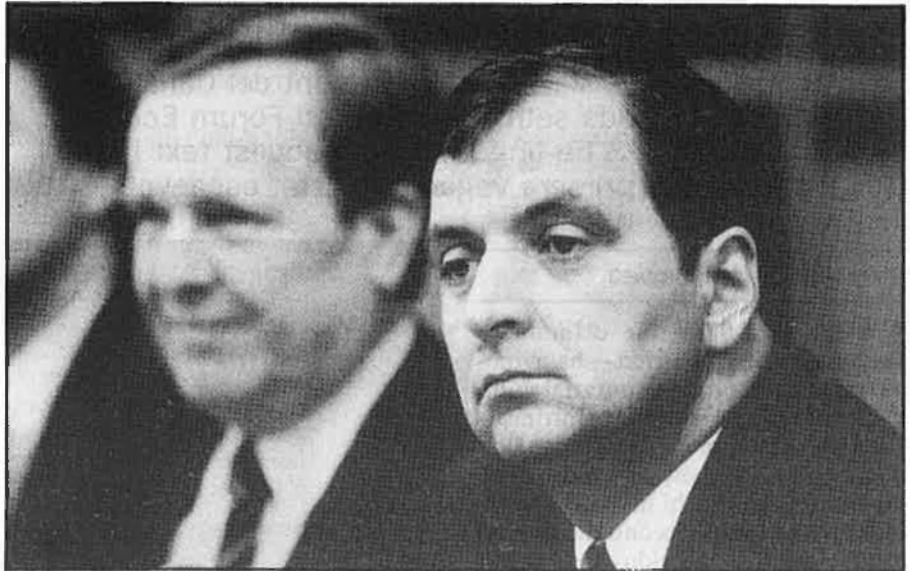
Klaus Töpfer, ministre federal del Medi Ambient.