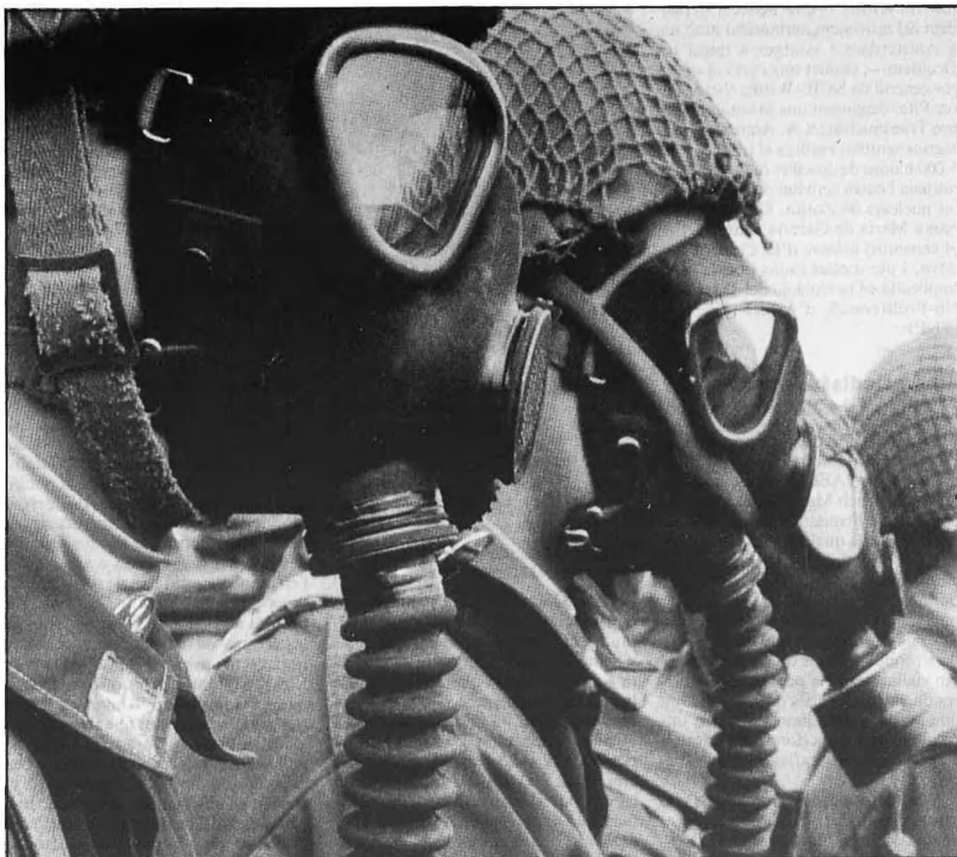
Després de les armes químiques, la bomba atòmica.

llicència a Transnuklear, ateses les sospites cada vegada més evidents que aquesta empresa porta ja molts anys violant les lleis, lleis que per altra banda els verds qualifiquen d'antiquades (daten de 1969) tot posant de manifest les deficiències i incapacitat del control estatal. Tanmateix, és en aquest debat quan l'oposició retreu al ministre els nombrosos punts foscos de l'escàndol i es dona un ultimàtum a les societats hidroelèctriques R W E i Degussa a fi que acomiadin els directius de les firmes de transport Nukem i Transnuklear.