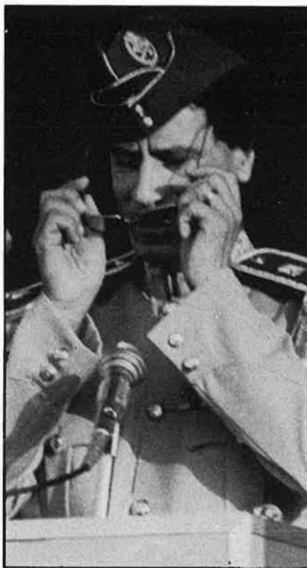
Gaddafi: crear la bomba islàmica.

Ara bé, deixant de banda la sortosa incongruència que hagi estat un periodista el descabellador de la llana nuclear, fet que per altre cantó posa en