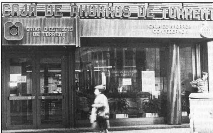
Caixa de Torrent: encara no ha respost a la fusió proposada per la d'Alacant i Múrcia.