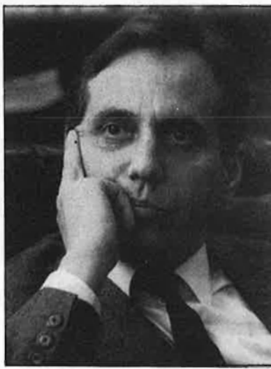
«Per a mi el nacionalisme és un element de reflexió política molt important».

—Hi ha diversos mètodes per aproximar-se a aquesta pregunta. Si en un míting veus senyores amb abrics de pells, pots pensar que és un míting de dretes, i si veus gent normal i corrent pots pensar que es tracta del míting d'un partit d'esquerres. Una primera aproximació a què és l'esquerra va donada, doncs, per les forces i els sectors socials que li donen suport, que solen ser els més subordinats. Es tracta només d'una aproximació, però penso que és un factor important. El segon mètode d'aproximació és el dels discriminants històrics, ja que