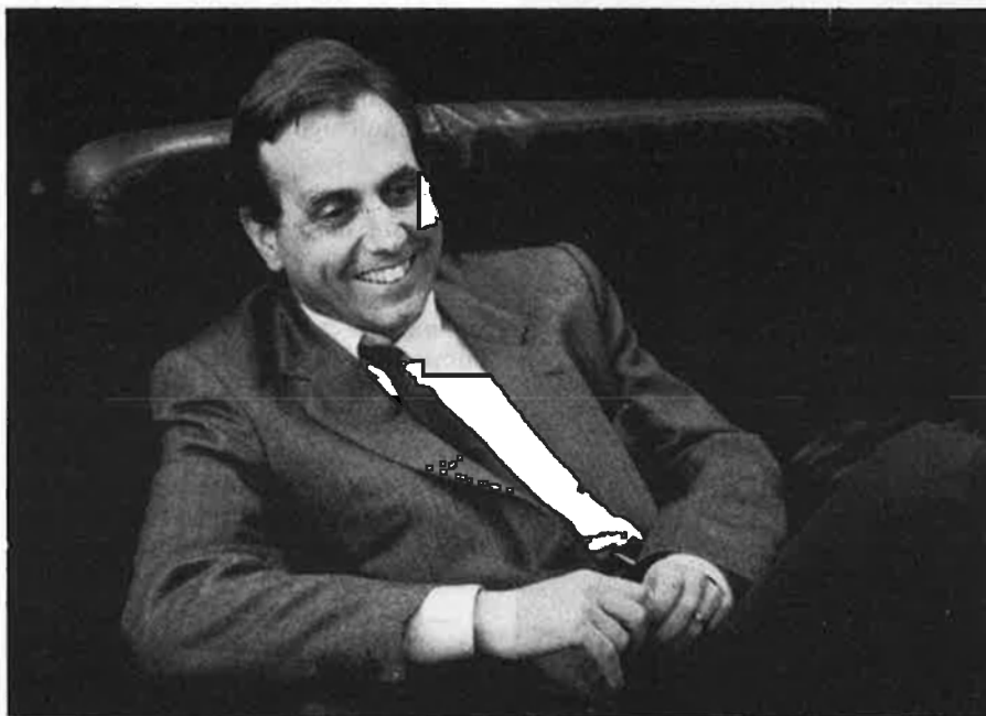
«Pujol és el responsable que Catalunya tingui un sostre d'autogovern més baix que Euskadi».

—¿El de la distracció? Home..., és un debat distret. Per primera vegada en molt de temps ha estat el gran debat de les idees polítiques, una mica separat del nivell somort i penós del que és la discussió política a nivell de l'estat. El federalisme és, a més, el desllorigador per al procés d'adequació de les estructures de l'estat a les realitats nacionals del mateix Estat espanyol.