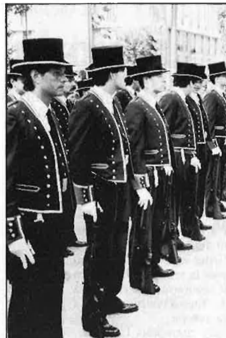
¿Una seguretat incontrolable des de Barcelona?