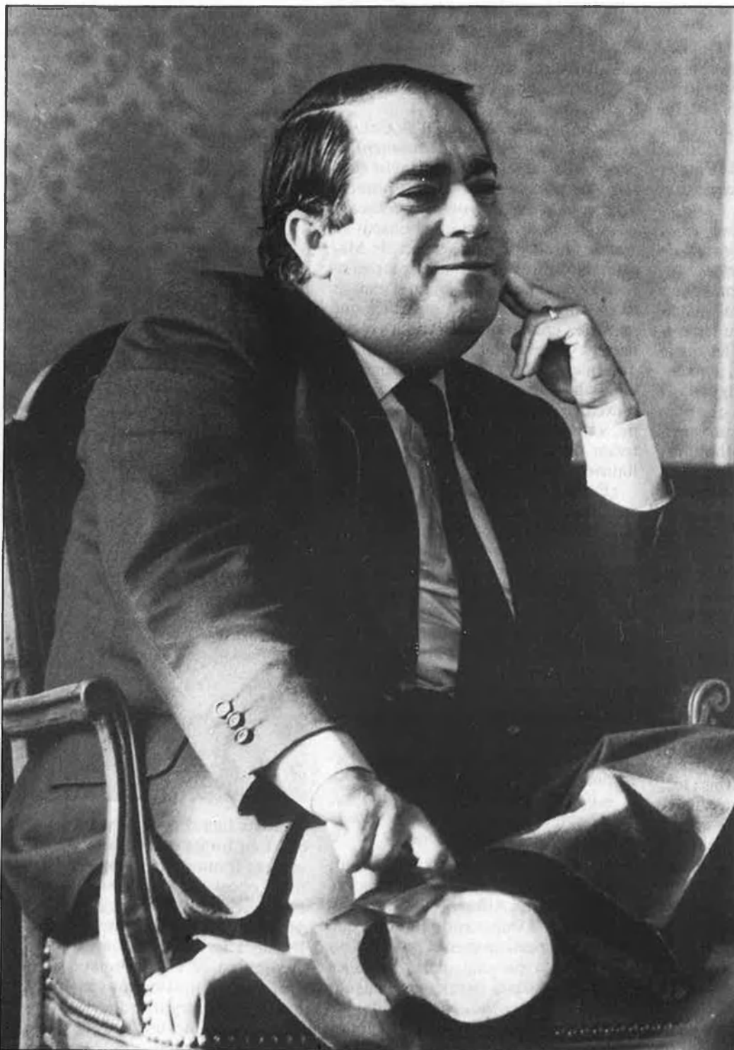
«Molts ho voldrien saber, què faig».

Era un problema d'erosió política i d'aplicació arbitrària de la demagògia, i no su-