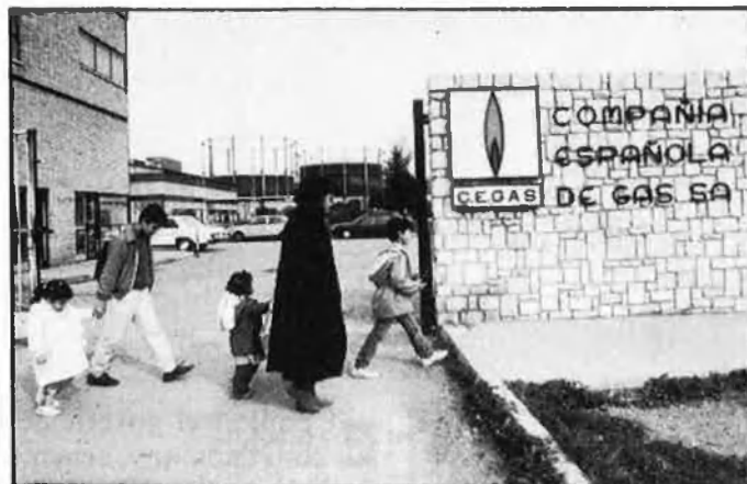
L'ALTRA INSEGURETAT CIUTADANA