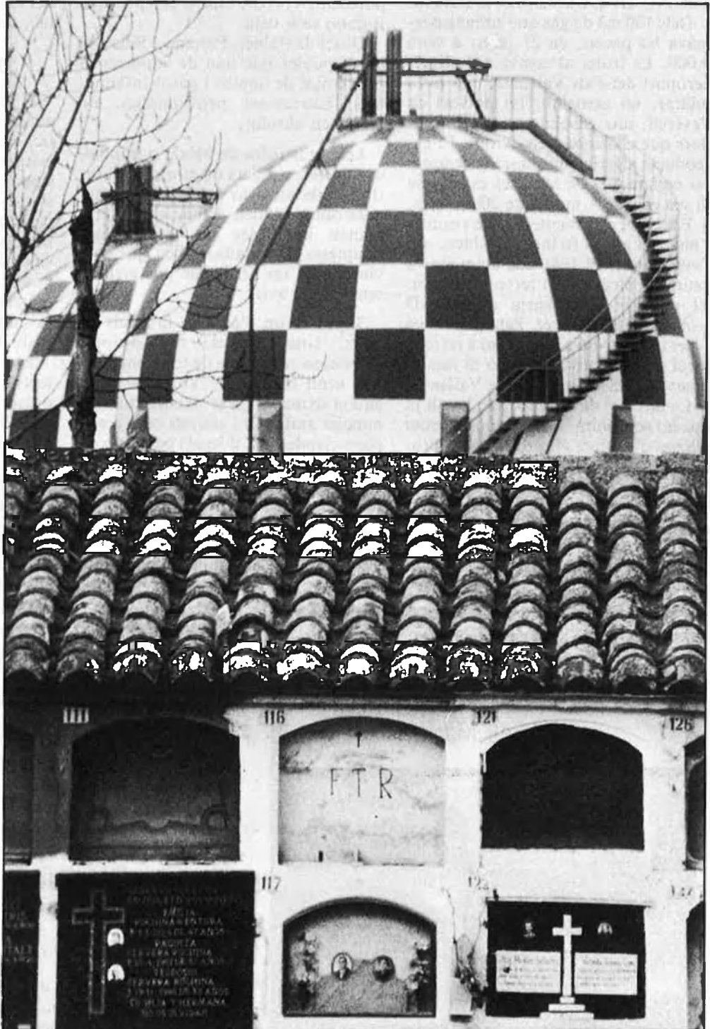
Instal·lacions de Butano a Manises.

Als matolls i les escombraries adjacents a Campsa se succeeixen normalment els incendis de deixalles. L'empresa ha anunciat que abandonarà aquests terrenys abans del 1992 per instal·lar-se al polígon industrial d'Albui-xech, en una parcel·la de la seua propietat. En medis ecologistes i veïnals els dubtes sobre el tal trasllat són patents.