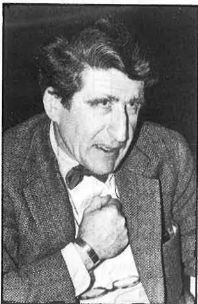
«La meua obra s'ha de comprendre a través de la tradició italiana».

—Jo vaig començar a pintar abans de saber escriure. Em sent molt lligat a un episodi molt tendre de la meua vida. El meu avi, que jo estimava molt, era un home que no havia acceptat el passatge del segle XIX al XX, aleshores es va recloure a casa, i no va voler eixir-ne en vint anys. A casa es feia passar per sord, i va ensenyar-me a comunicar-me amb ell, fent petits dibuixos. Per això, he començat a pintar abans de saber escriure i parlar.