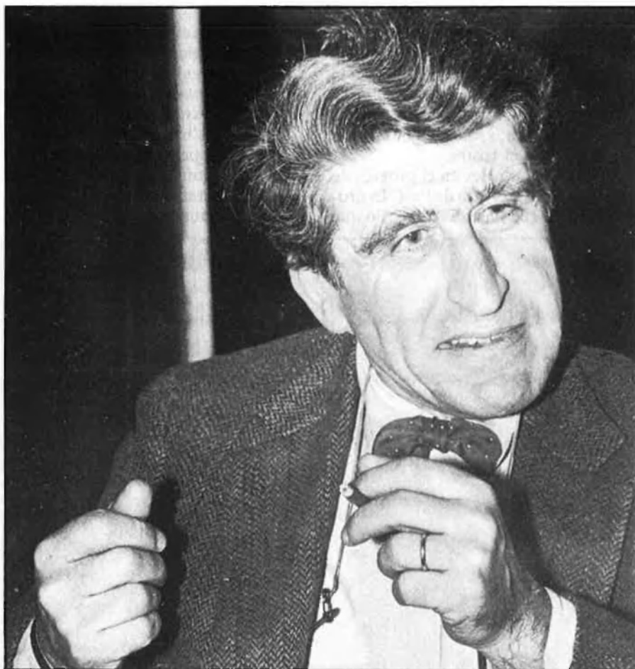
«Les etiquetes serveixen per a assegurar-se davant la complexitat de la història de l'art».

socràtics; ha estat un Richard Wagner, el que ha fet el seu heroi fill d'un incest... El XX ha fet sols, al meu entendre, una revolució formal, buscant l'embolcall per a la gran revolució ètica i moral i del pensament de finals del segle XIX.