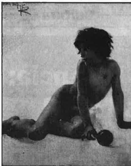
Sorolla, present en una antològica sobre el mar.

El primer coliseu de València, el Teatre Principal, té programats, entre