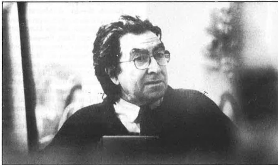
Antoni Tàpies, que a l'abril exposarà al Tinell.

El Teatre València Cinema acaba d'estrenar l'obra de Woody Allen , Play it again, Sam! , per la Companyia Curial . S'ofrirà en versió catalana i