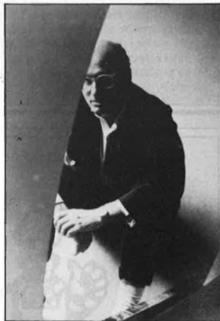
Michael Nyman, minimal i popular.

El currículum de Nyman és força envejable. Compositor vocacional des de molt petit, aplicat estudiant, la seva entrada a la música activa començà cap als principis dels setanta, amb la Scratch Orchestra, formació germinal on hi havia un jove Brian Eno. Fou precisament ell qui, l'any 76, al seu èfimer però interessant segell Obscure Records, publicaria el primer llarga durada de Michael Nyman, Decay music , basant-se en una pel·lícula del director Peter Greenaway (a qui, sis anys després faria, recollint l'esperit de Henry Purcell, la banda sonora d' El contracte