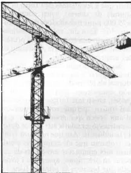
L'evolució de les tècniques constructores: una trava per als no especialistes.

Els constructors estan esperançats amb aquest panorama, que farà oblidar els més de deu anys de crisi que han tingut. Qui els fa més por és la lentitud de l'administració i la reduïda capacitat de finançament públic, que po-