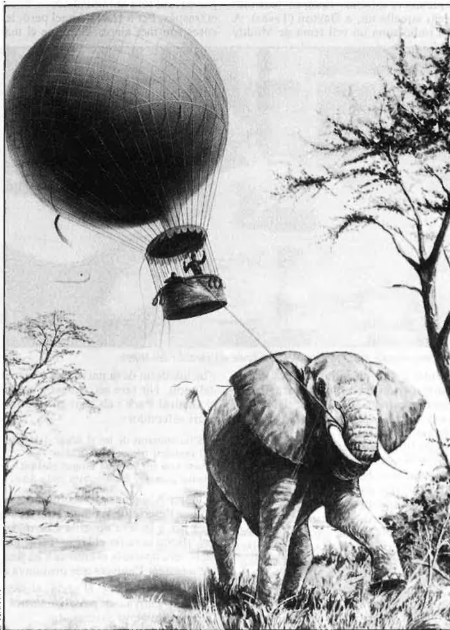
Il·lustració per a «Cinc setmanes en globus».

L'àmbit on l'aventura és possible s'ha anat eixamplant, doncs, dels boscos europeus a l'espai interplanetari. I d'aquí a l'intergalàctic i a l'interestelar, que, segons sembla, és l'aventura que els temps ens han designat i que difícilment podem emprendre si els déus no ens afavoreixen amb les qualitats d'Ulisses i la NASA ens admet de cosmonautes. □