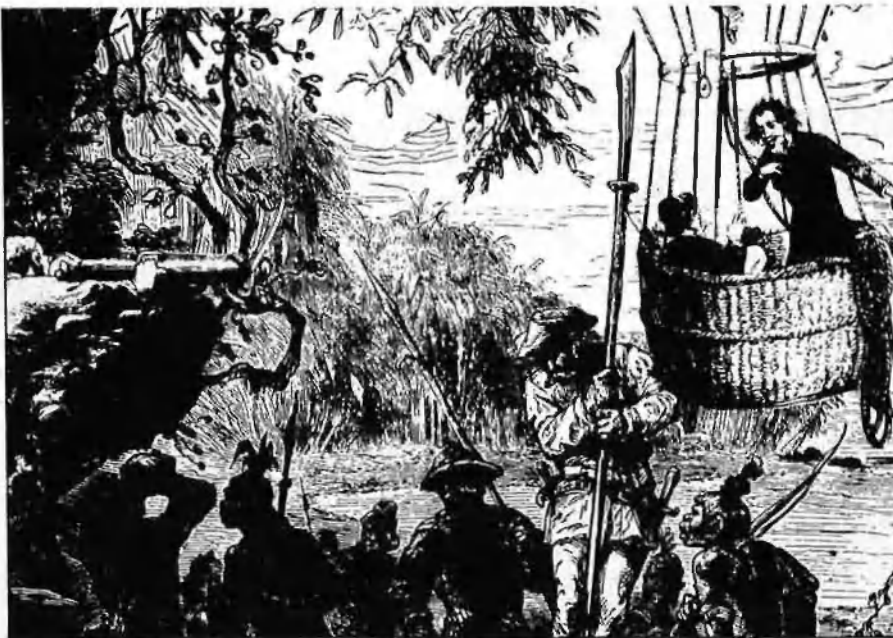
Una exposició homenatge a autors i obres que encara fan desitjar arribar a mons desconeguts.