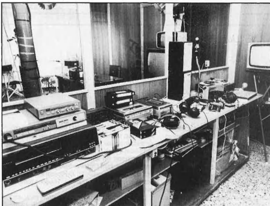
MALLORCA: PORTA TANCADA A LA LLIBERTAT D'EXPRESSIONÍ