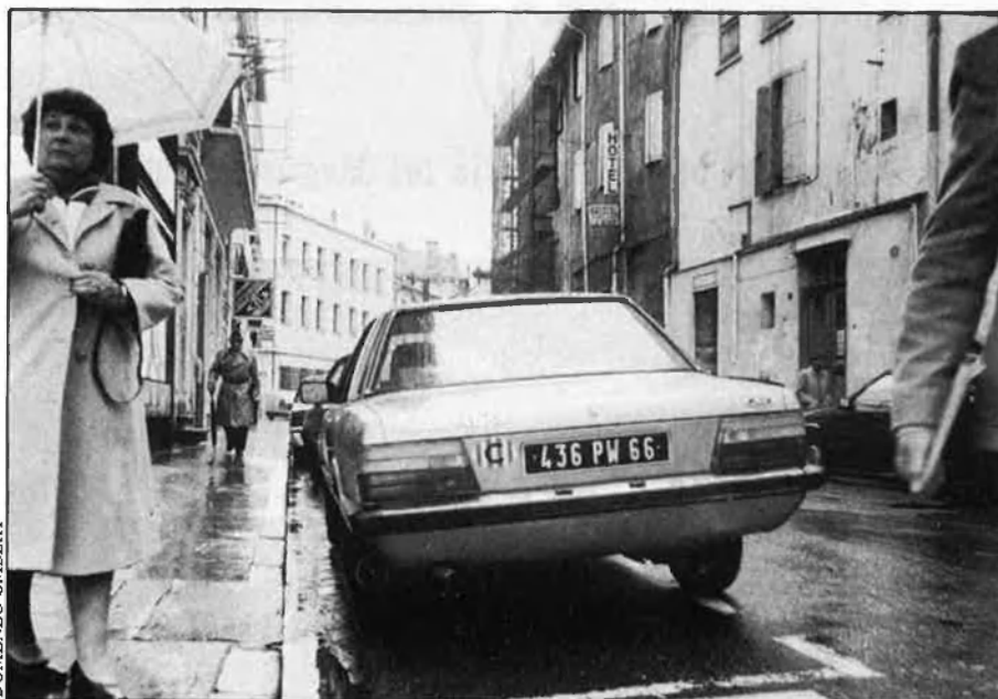
Integrar-se en l'àmbit català: de consigna militant a crit de guerra d'empresaris i financers.

El fet que la cultura de creació —art, música, literatura— que es fa ara a Catalunya Nord sigui catalana, o que hi hagi més nens que mai aprenent català a les escoles, o que hi hagi un setmanari i una ràdio locals en català, a banda de l'arribada de les ones de TV3,