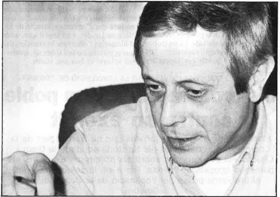
«La pressió internacional ha de forçar les dues parts a negociar».

za. Israel pot tenir una situació justa i democràtica dins del seu estat, però als territoris que ocupa això s'ha acabat. Allà s'estan aplicant unes lleis d'emergència que eren les que els britànics van aplicar als mateixos israelians abans del 48. La mateixa legislació que va permetre els britànics deportar els líders israelians, ara l'estan aplicant per deportar els palestins. A Cisjordània i Gaza, la situació és