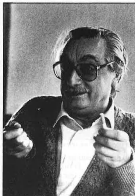
Manent, sobre Foix, Reventós i Fuster.