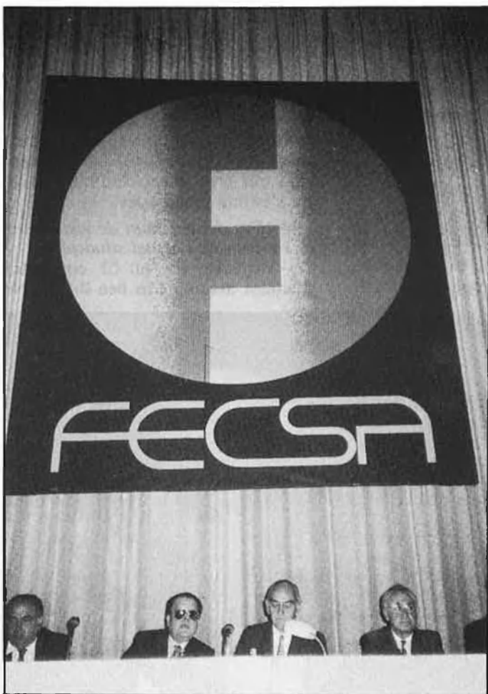
Luis Magaña: la volta al món darrere els creditors de FECSA.

d'això, almenys, les accions de FECSA podran tornar a cotitzar en borsa i la de Barcelona podrà cantar victòria: les accions de FECSA, abans de la crisi, eren el principal valor de la Borsa de Barcelona i, malgrat que se'n va suspendre la cotització el febrer passat, el volum de negoci del mercat barceloní va créixer l'any passat un 85 per cent per damunt del volum de l'any anterior. □