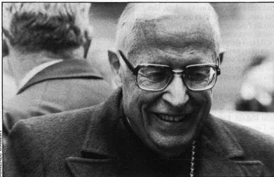
Cardenal Jubany, pròxim a la jubilació.

L'altra modalitat correspon a estats amb acord amb el Vaticà, com és el cas de l'espanyol en el moment present, en què regeix un conveni —de 28 de juliol de 1976— entre el govern de Madrid i la Santa Seu. L'articulat d'aquest