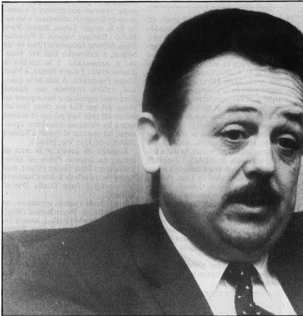
«Van perforar-me els pulmons, la pleura, el diafragma i em van seccionar una costella...»

—Sí, sí, encara. Pensi que encara tinc dins la caixa toràctica, als pulmons... És que van ser unes lesions tan grans a òrgans vitals que... Van