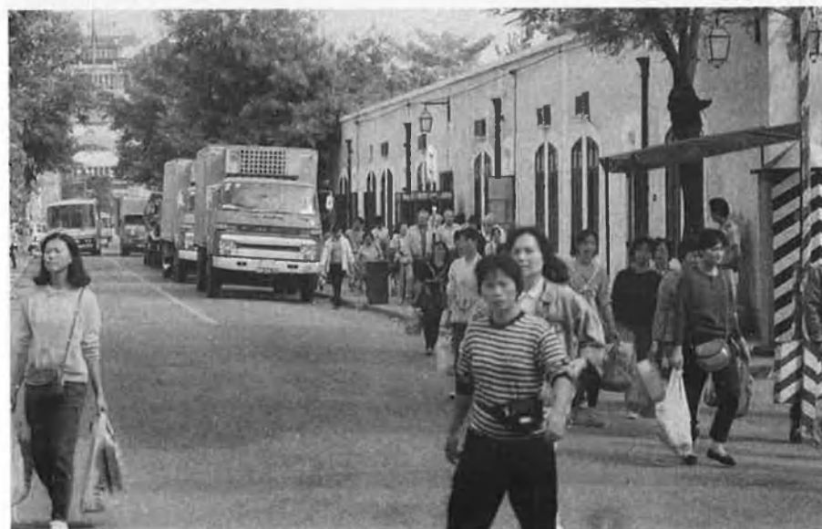
Un canvi lent, sota el control del no sempre ben avingut PCX.