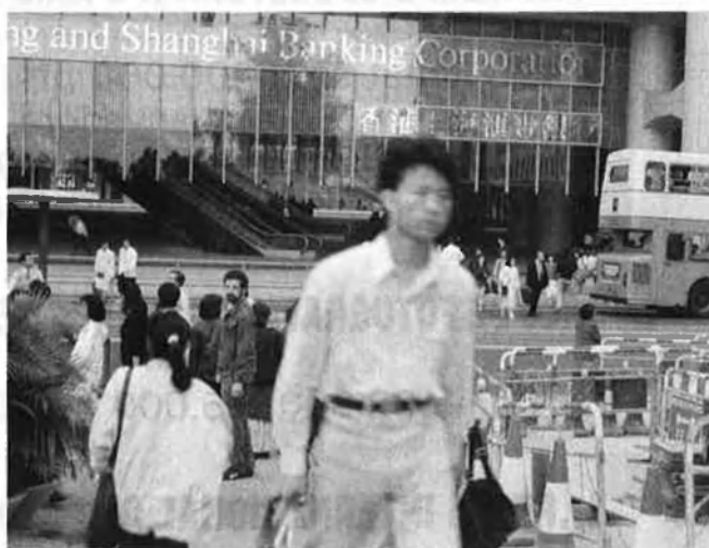
Hong Kong: «Un país, dos sistemes».

laterra consolidaren el poder britànic al racó xinès, i després de pactes i tractats, 235 illes i illots passarien als britànics fins avui. La més gran i coneguda és l'illa de Hong Kong, que, amb Kowloon —una part de terreny peninsular—, constitueix el tercer centre financer del món; aquesta colònia que feia gràcia al príncep regent i que és coneguda, entre d'altres noms, com la finestra xinesa a Occident. El centre comercial i port estratègic, que l'any 1851 tenia 33.000 habitants, en té avui 6 milions, 98 per cent xinesos. Les guerres internes i exteriors de Xina han fet ploure durant els segles XIX i XX una permanent immigració cap al paradís britànic . Avui, encara, dotzenes d'em-