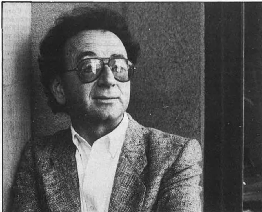
«El desig dels dies» no és una novel·la «à-clef».

—A mi, em semblaria molt bé aquesta crítica del concepte d'identitat, si incloguera totes les identitats col·lectives. Però, ¿per què han de criticar no més les identitats de grup d'altres, i no la pròpia? ¿Per què els posa tan frenètics l'amenaçada d'identitat de les nostres nacions sense estat i no qüestionen la seua, tan potent? Perquè, si