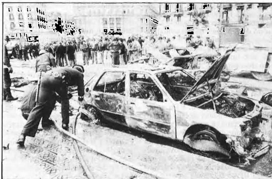
Imatges de dos atemptats perpetrats per ETA a Barcelona al llarg del 87.

França per dur a cap accions amb relativa impunitat.