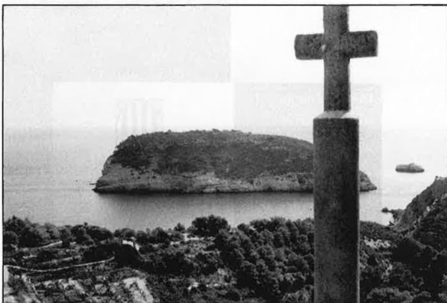
Zona costanera dels Pallers. Enfront, l'illa del Portitxol.

novembre, en què s'informà del contingut de la visita al president i de la posició favorable de la Generalitat, s'ha iniciat una campanya conjunta entre l'Ateneu Cultural Xàbia, UPV i un nombrós grup de particulars, a fi d'informar-ne tot el poble, ja que l'Ajuntament ha renunciat a fer-ho. Aquestes organitzacions han previst una captació de signatures en contra del projecte i intentar fer arribar informació a tots els mitjans de comunica-