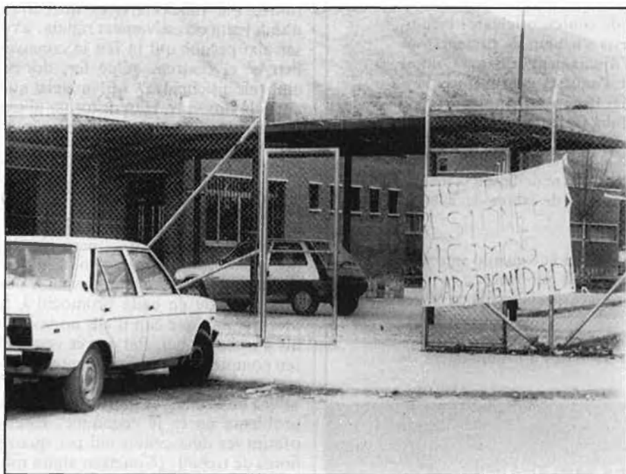
«Seguretat i dignitat», difícilment assolibles amb les condicions actuals.

«Psicòpates és un terme errat, encunyat a finals del segle XIX i encara de moda. No hi ha tal categoria espe-