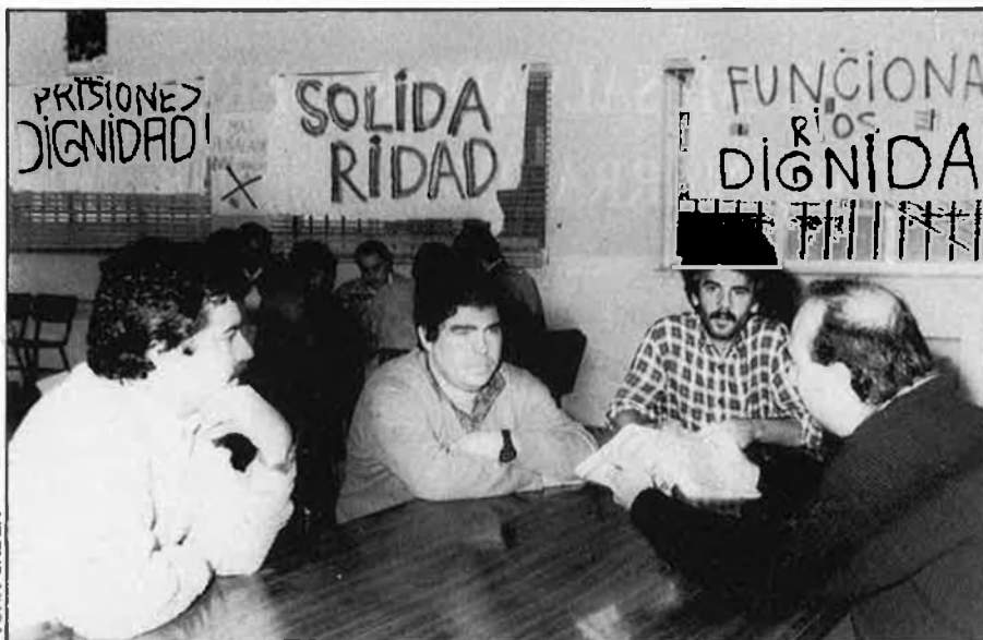
Funcionaris: «Açò és un frau per a les famílies que hi tenen interns».

«La classificació ací funciona molt malament. Açò no és un sanatori, és un magatzem de la gent que no volen en altres llocs —acusen tots. A Madrid —comenten— es creuen que és un centre model, pero res del que se'n diu, te-