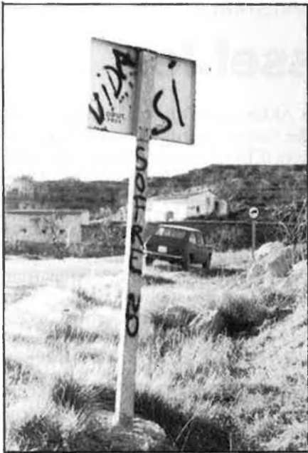
Tot i mantenir que no contamina, Endesa ja intenta reduir les emissions de sofre.

en les rodalies hi ha el 55 per cent de les reserves de carbó de l'estat.