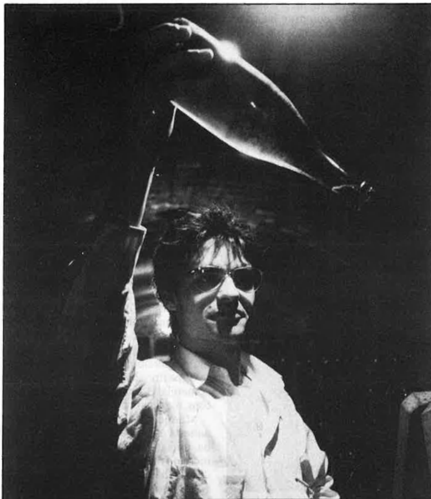
La guerra del cava presenta ja importants batalles guanyades.