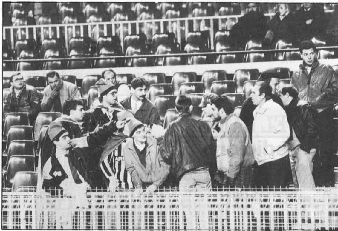
Moment en què els «morenos» arrabassen la pancarta.

Una altra agressió per part dels anomenats morenos , la relata Quim Manresa , fotògraf de La Vanguardia : «Era durant la reunió en què va dimitir l'anterior entrenador, Terry Venables . Va