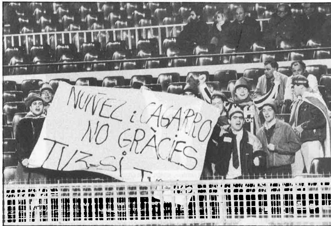
Una de les polèmiques imatges emeses per TV3.