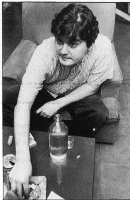
«Facis el que facis estàs agafat».