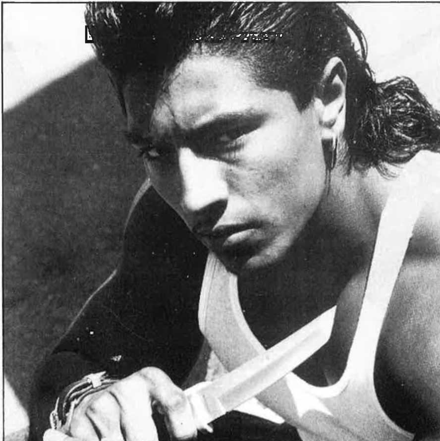
«Chicano», un terme pejoratiu que va adquirir caràcter d'afirmació.

Quan el rock&roll fa aparició, era ineludible que, pel seu dinamisme, acabés per prendre contacte amb la riquesa musical chicana . Del-Fi Records s'especialitzà en gravacions de mexicans residents a Los Angeles. Després d'uns discrets inicis, el productor Bob Keane ensopegà l'any 1958 amb un tal Ricardo Valenzuela, que comandava The Silhouettes, una banda molt coneguda al seu barri, i que acabaria per convertir-se en Ritchie Valens. Malauradament, un any més tard, el 3 de febrer de 1959, desaparegué en el mateix accident que s'emportava a l'altre món Buddy Holly i Big Bopper. Tanmateix, va viure prou per a enregistrar —entre