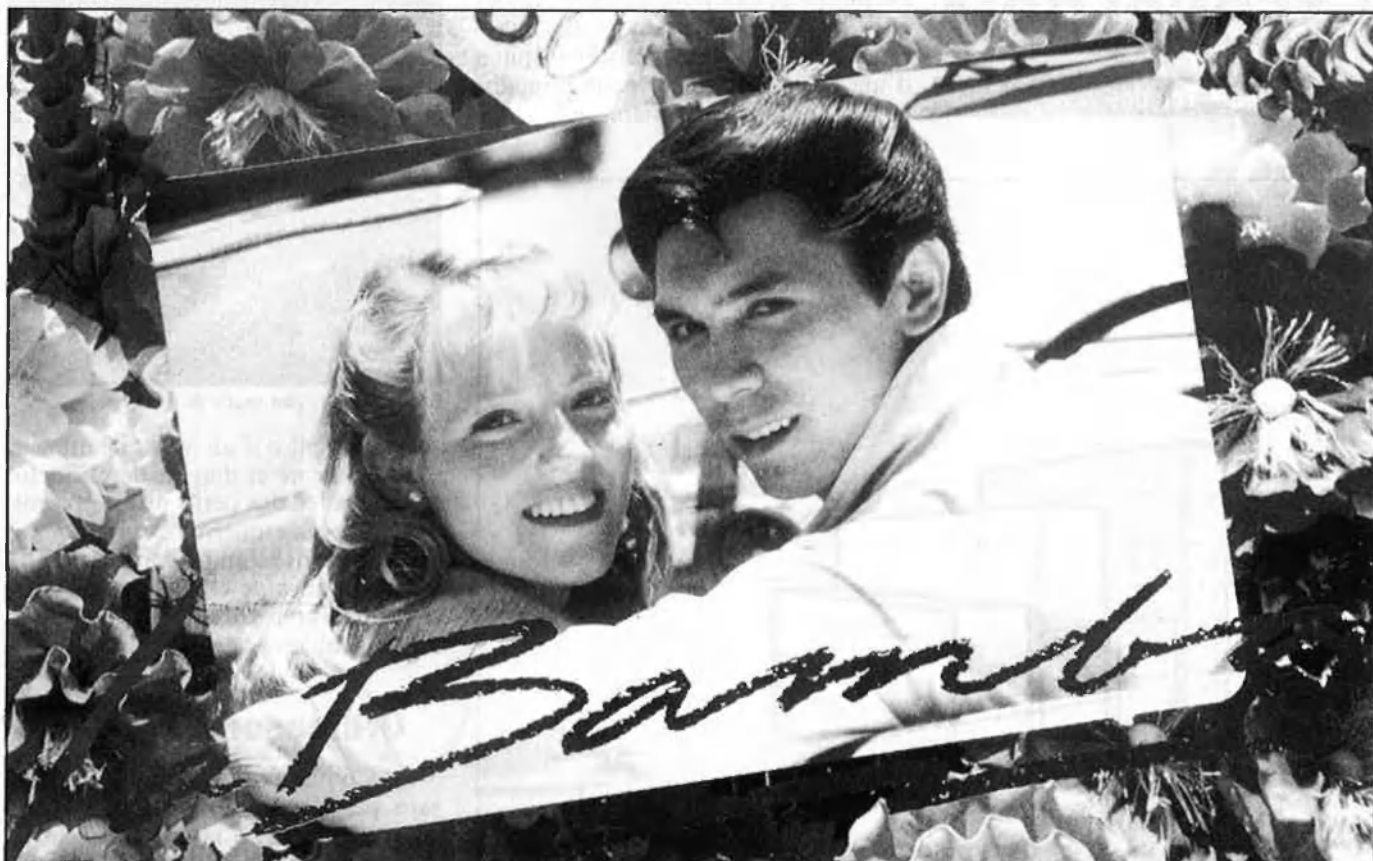
Flors mexicanes per a «La bamba».

Per introduir-se al cada vegada més embolicat i fascinant escenari de les vibracions chicanas , res millor que localitzar les tres recopilacions discogràfiques que reportem en aquest mateix article. □