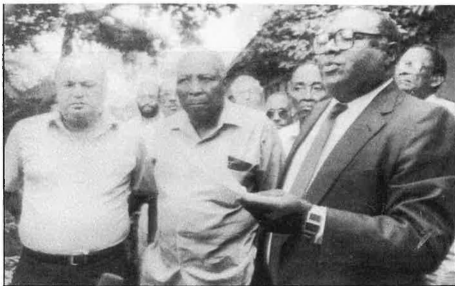
Louis Déjoie i dos candidats més fan declaracions després de la matança.

gredients bàsics per engegar una revol- ta contra els vestigis del poder duval- leria.