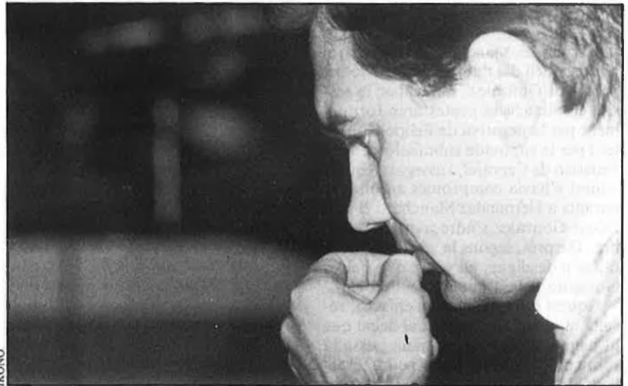
«La dreta ha provocat tota una constel·lació de crisis».

— Tornant al debat polític. Diuen que en aquests moments vostè encarna una nova esquerra dins de CCOO.