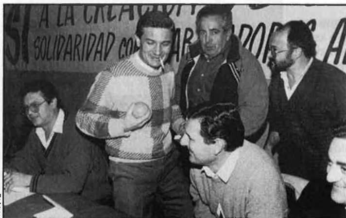
«Reduir el IV Congrés a un enfrontament personal és una ximpleria».

—Em refereixo, per exemple, a temes industrials, on tradicionalment només s'ha comptat amb els sindicats en els proces-