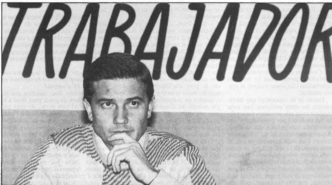
ANTONIO GUTIÉRREZ, NOU SECRETARI GENERAL DE CCOO